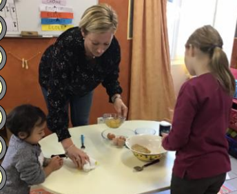
Gâteau aux noix