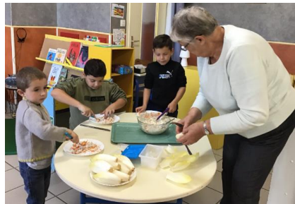
Endives-surimi-fromage à tartiner