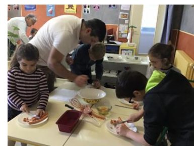
cake aux saucisses et cornichons