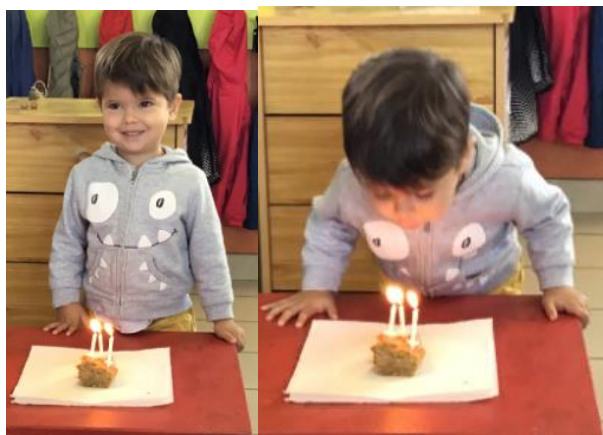
JOY - 3 ans